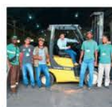
07 a 09/12 Operador de Empilhadeira P. Dom Bosco e COOMAP Paraguaçu-MG