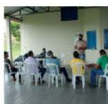
27 a 29/11 Op. e Manutenção Motoserra P. Dom Bosco e Inovação Paraguaçu-MG