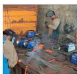
21 a 24/11 Curso de Solda São Sagrado Coração de Jesus Paraguaçu-MG