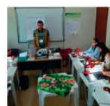
12 a 16/12 Curso Q. e Degustação de Café COOMAP Paraguaçu-MG