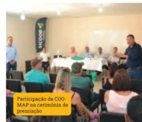
Participação da COOMAP na cerimônia de premiação.