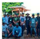
11 a 15/12 Trator – Operação com Implementos São Grêmio Paraguaçu-MG