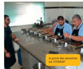
A prova das amostras na COOMAP.