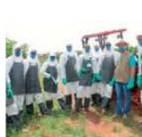
20 a 22/11 Aplicação Trat. de Defensivos Agrícolas Pol. D. Boro e Inovação Paraguaçu-MG