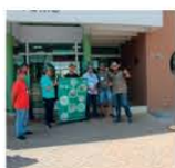
15 a 16/11 e 17 a 18/11 Drone – Operações Básicas – 2 turmas Autoria: COOMAP Paraguaçu-MG