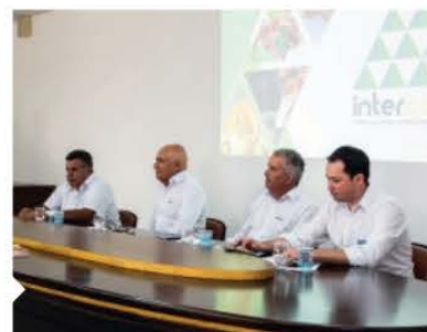
O lançamento do Sistema InterCoop não é apenas um marco, mas um ponto de virada para uma "Nova Coccamig".