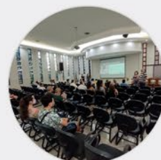
19 /FEV ENCERRAMENTO DO CURSO DE SUCESSÃO FAMILIAR Aciap/CDL