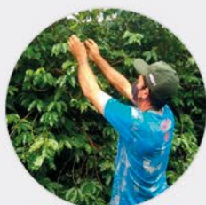
4 a 6 /FEV CURSO DE MANEJO INTEGRADO DE PRAGAS E DOENÇAS Poliesportivo Dom Bosco