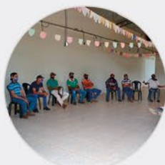
18 a 20 /FEV CURSO DE OPERADOR DE MOTOSSERRA – OPERAÇÃO E MANUTENÇÃO Bairro Cachoeira