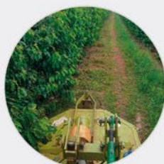
11 a 13 /FEV CURSO DE TRATOR AGRÍCOLA DE PNEUS-TAP – OPERAÇÃO COM IMPLEMENTOS Bairro Penereiro