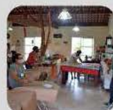
CURSO DE CONFECÇÃO DO VESTUÁRIO FEMININO

15 A 16/12 - LOCAL: SITIO DO COTÃO - JARDIM CHAGRELA