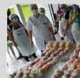
PRODUÇÃO ARTESANAL DE POLPA DE FRUTAS

14 A 16/11 - LOCAL: POLIESPORTIVO DOM BOSCO