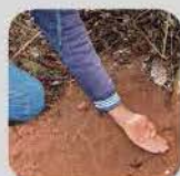
MANEJO INTEGRADO DE PRAGAS E DOENÇAS (MIP&D)

28/11 A 01/12 - LOCAL: POL. DOM BOSCO II, MANGALHIM