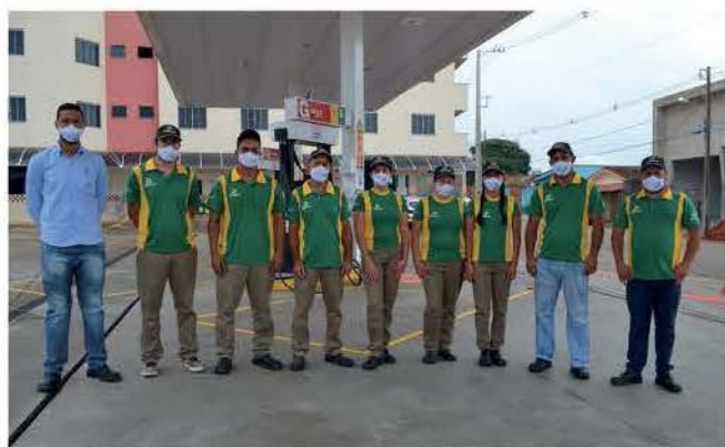
Time de colaboradores do Auto Posto Coomap