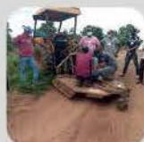
TRATOR - TAP OPERAÇÃO COM IMPLEMENTOS

28/11 A 01/12 - LOCAL: POL. DOM BOSCO II, MANGALHIM