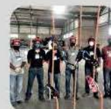
TREINAMENTO DE TRABALHO EM ALTURA

14 A 16/11 - LOCAL: POLIESPORTIVO DOM BOSCO