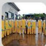
APLICAÇÃO TRATORIZADA DE DEF. AGRÍCOLAS

11 A 15/11 - LOCAL: POLIESPORTIVO DOM BOSCO E SITIO SANTA CLAYDA