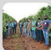
MANEJO INTEGRADO DE PRAGAS E DOENÇAS (MIP&D)

11 A 15/11 - LOCAL: POLIESPORTIVO DOM BOSCO E SITIO SANTA CLAYDA