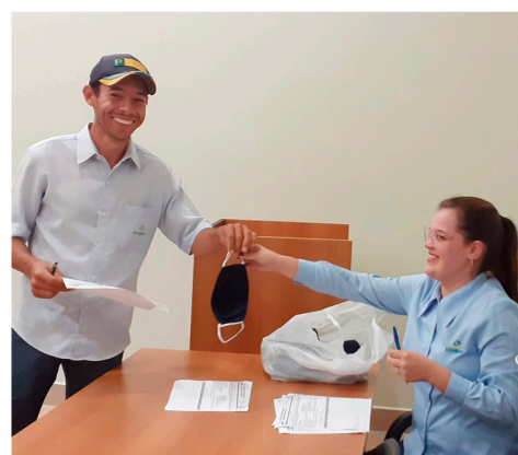
Em março a COOMAP deu início às entregas de máscaras aos colaboradores