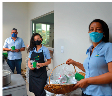
O kit é composto de máscara, caneca e álcool em gel

Esse reforço dos cuidados com a Covid-19 foi feito depois que a prefeitura divulgou o aumento de casos da doença no município.