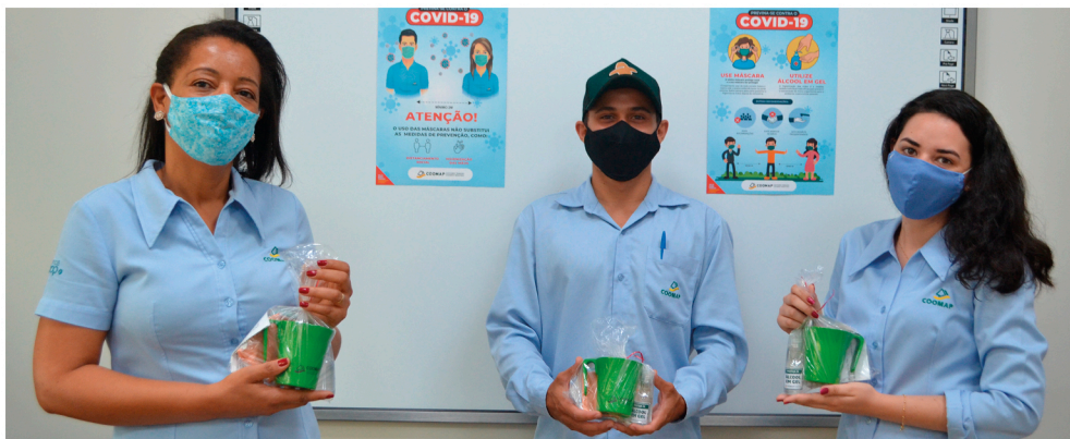
A entrega do kit foi em outubro passado

A COOMAP montou e entregou, no começo de outubro, um kit com caneca, duas máscaras e álcool em gel, para cada um dos colaboradores, para prevenção da Covid-19. Esta foi mais uma vez que a Cooperativa forneceu máscaras aos colaboradores durante a pandemia.