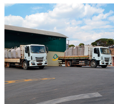
O movimento é grande nos armazéns de café

Q uem mora próximo à COOMAP, no Distrito Industrial, ou passa por ali com frequência, já se acostumou com a movimentação de caminhões o dia todo: é o Setor de Armazém. Principalmente durante a safra, o entra e sai de veículos que trazem o café dos cooperados é constante e muitas vezes vai além do horário comercial.