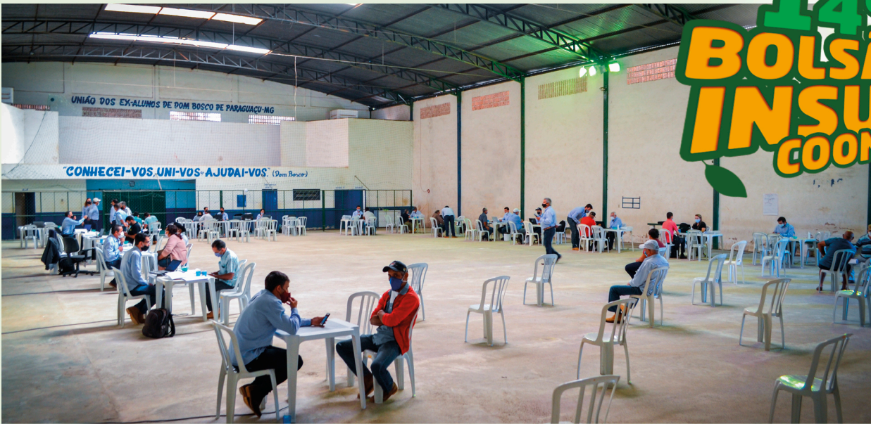
14º Bolsão de Insumos movimentou o Poliesportivo Dom Bosco