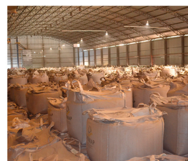
Os armazéns tem a capacidade de armazenamento de 260.000 sacas