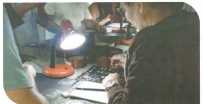
Aula prática de classificação de cafés.