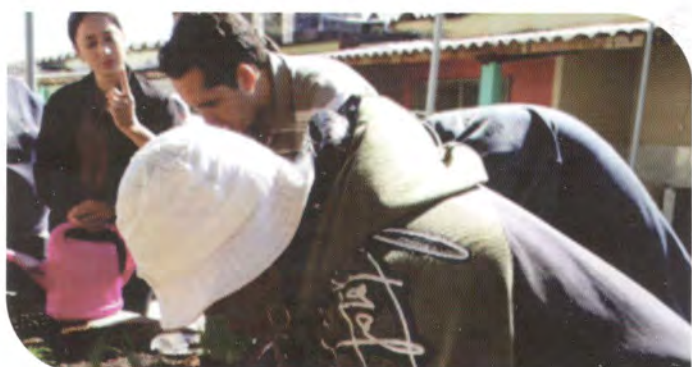
O colaborador da COOMAP ensina aos alunos da APAE as técnicas para o cultivo de hortaliças.