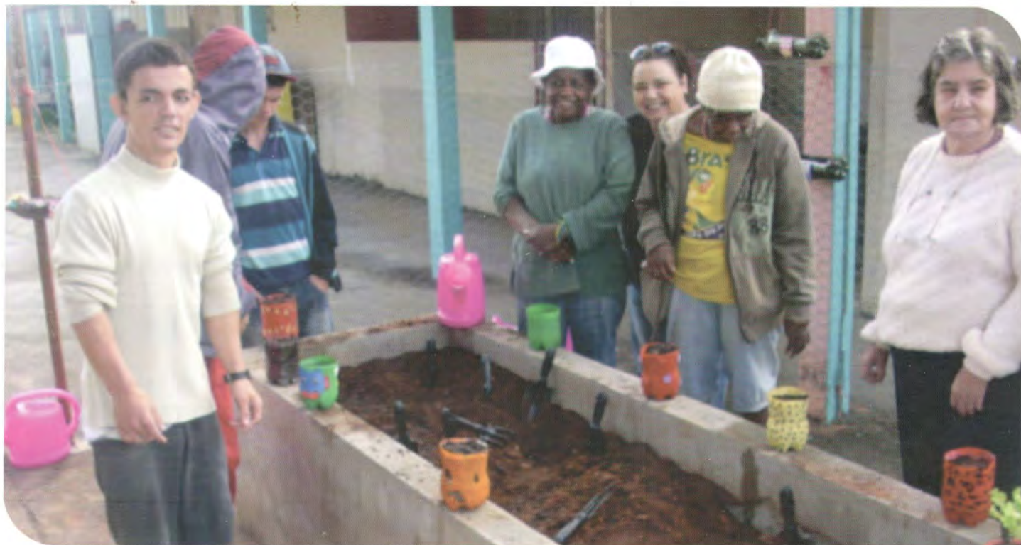
Preparação de canteiro para a implantação da horta na APAE.

A APAE de Paraguaçu, iniciou o cultivo de hortaliças, num projeto de horta didática, desenvolvendo conhecimentos e habilidades que estimulam os alunos a produzir, descobrir, selecionar e consumir alimentos saudáveis, bem como hábitos de higiene, cuidado e a conservação ambiental.