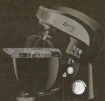
Batedeira Planetária Lenoxx