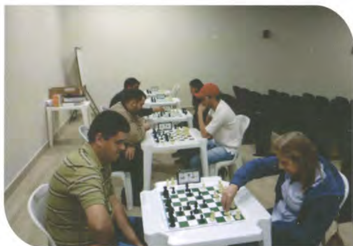
Colaboradores da COOMAP durante aula prática de xadrez.

Entre elas, está o poder de concentração e raciocínio lógico, a criação de estratégias para propor soluções inovadoras, a iniciativa para a tomada de decisões e a persistência.