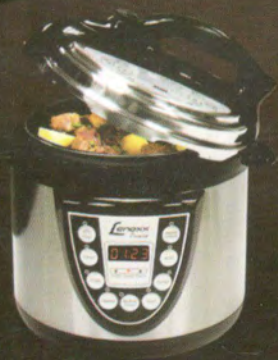
Panela Elétrica Lenoxx

Temos o direito de corrigir eventuais erros de impressão e digitação.