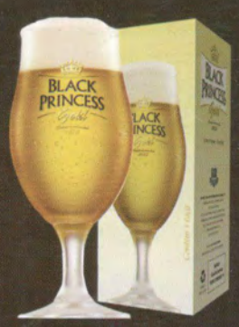
Taça cerveja Ruvolo

AV. Orlando Alves Pereira, 191 - Distrito Industrial