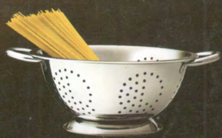
Escorredor de Massas Class Home