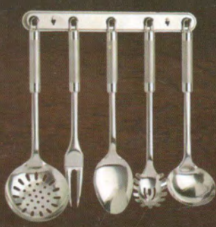
Talheres Class Home