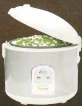
Panela de Arroz Lenoxx