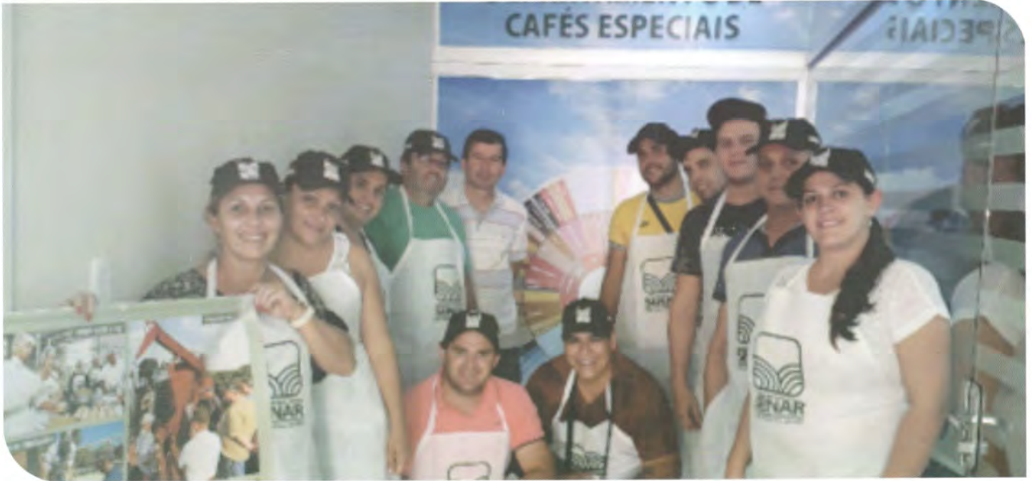
Participantes do curso de classificação e degustação de café.

O objetivo maior do curso é ajudar os cooperados e descendentes a produzirem um café de qualidade. Os alunos aprendem a classificar os grãos e a distinguir as várias qualidades nas degustações do café, apurando características, aroma e o sabor da bebida. São apresentadas as espécies de café, origem e tratamento na pós-colheita, e também a diferença do café tradicional para o gourmet. O produtor tem buscado tecnologia para obter um café com mais qualidade e, consequentemente, uma valorização do seu produto no mercado.