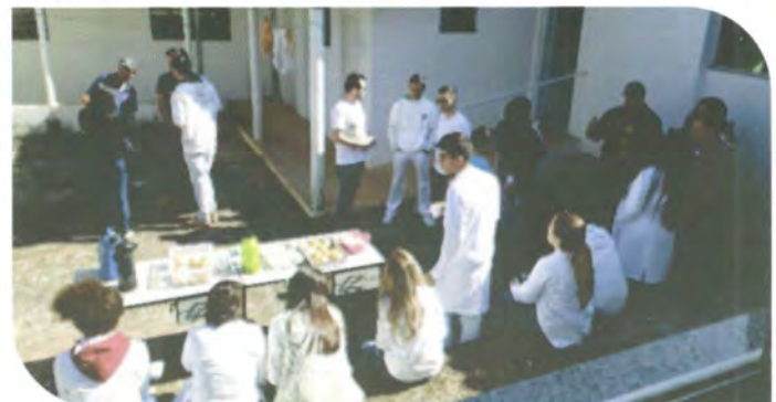
Produtores rurais prontos para a coleta de sangue para a coleta de sangue do projeto de toxicologia.

A COOMAP, em parceria com a UNIFENAS e Prefeitura Municipal de Paraguaçu iniciou o projeto COLHENDO E PLANTANDO SAÚDE, a fim de conscientizar a população do Município sobre a redução de agroquímicos nas lavouras e o seu uso racional.