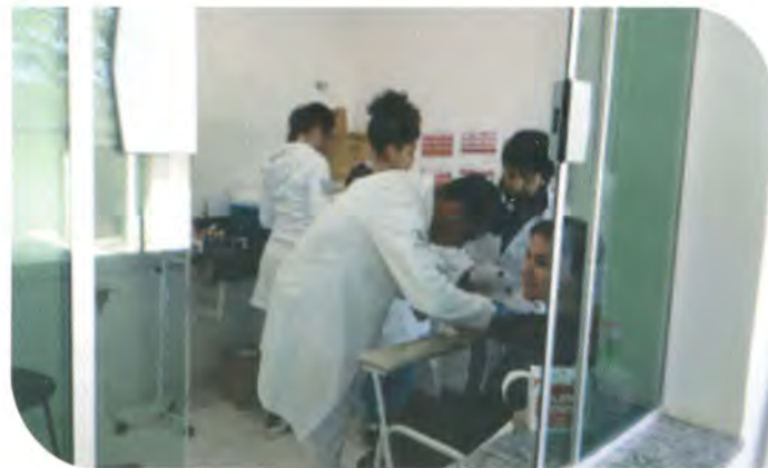
Produtora rural tendo seu sangue coletado para análise.

Em breve, a comunidade da Escaramuça, Sertãozinho, Lagoa e Perobas receberão o projeto, e esperamos que em breve, toda a população possa participar!