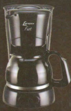
Cafeteira 14 e 30 cafés Lenoxx