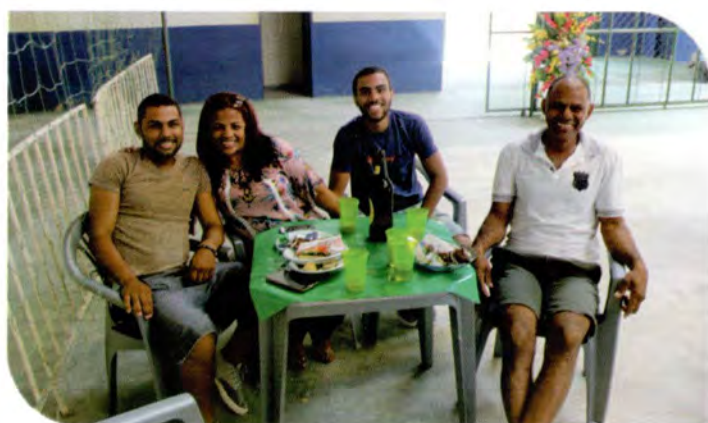
Muita dança, música e descontração.