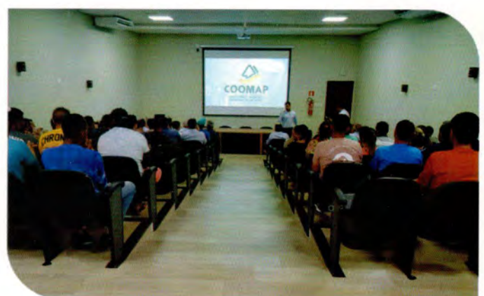
Colaboradores reunidos no auditório da COOMAP.