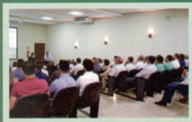
Evento corporativo com os parceiros da COOMAP.