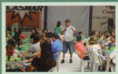
Confraternização dos colaboradores.

Muita emoção e alegria na comemoração do sexagésimo aniversário da Cooperativa.