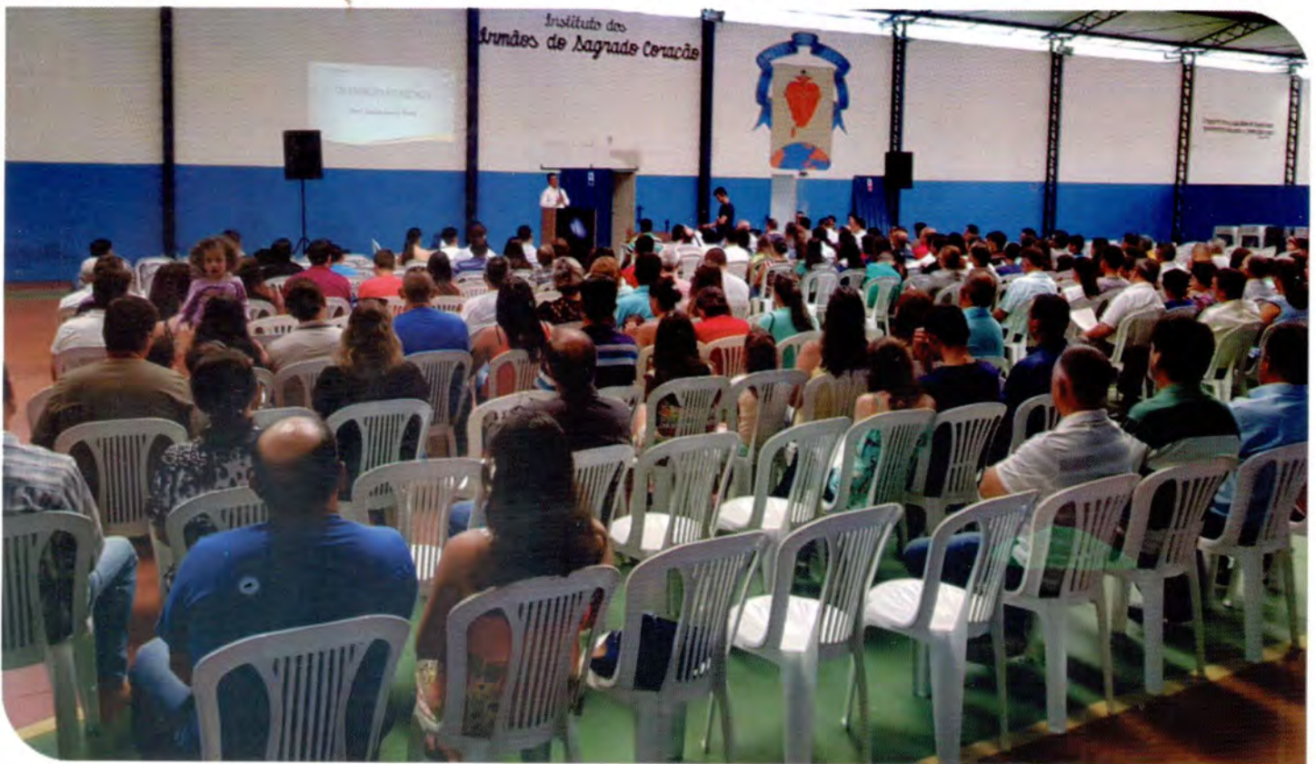
Cooperados reunidos para comemorar os 60 anos da Cooperativa.