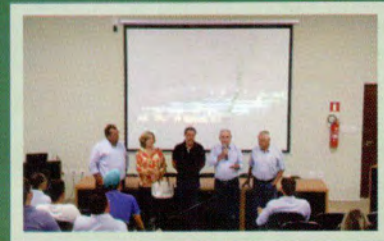
Reunião de encerramento do ano de 2017.