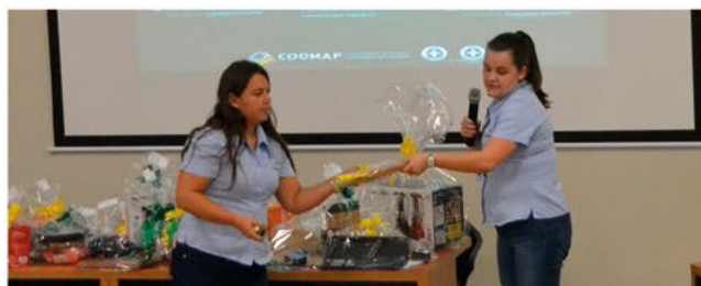
Ao final da SIPAT, as organizadoras fizeram o sorteio de brindes aos participantes.