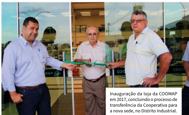
Inauguração da loja da COOMAP em 2017, concluindo o processo de transferência da Cooperativa para a nova sede, no Distrito Industrial.

Cultivando trabalho, colhendo resultado!