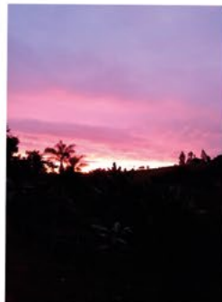
Adriano Reis Inácio Santos

▲ A foto do Ipê Rosa foi tirada pela colaboradora Cibele Tavares Marques, no começo de junho, no sítio onde o sogro dela é caseiro, no bairro Água Branca. O Ipê Rosa é uma árvore que pode chegar a mais de 30 metros de altura e floresce entre maio e setembro, deixando a copa da árvore totalmente colorida e embelezando a paisagem. Obrigado à Cibele pela participação.