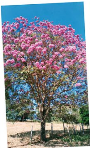
Cibele Tavares Marques

▲ A foto do Ipê Rosa foi tirada pela colaboradora Cibele Tavares Marques, no começo de junho, no sítio onde o sogro dela é caseiro, no bairro Água Branca. O Ipê Rosa é uma árvore que pode chegar a mais de 30 metros de altura e floresce entre maio e setembro, deixando a copa da árvore totalmente colorida e embelezando a paisagem. Obrigado à Cibele pela participação.