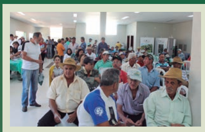
Projeto Balde Cheio Comemora 5 anos em Paraguaçu