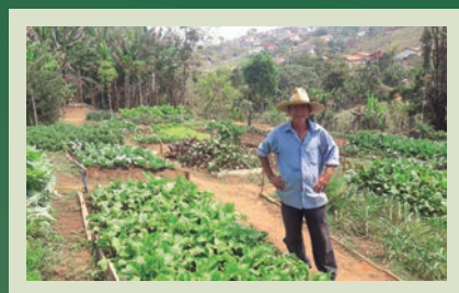
Conheça a Horta Orgânica do Lar São Vicente de Paulo

Para celebrar um ano de boa colheita, Coomap reúne cooperados e promove evento em parceria com Unifenas e Hospital Alzira Velano.