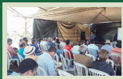
Confira os detalhes da 10ª Edição do Bolsão de Insumos da Coomap